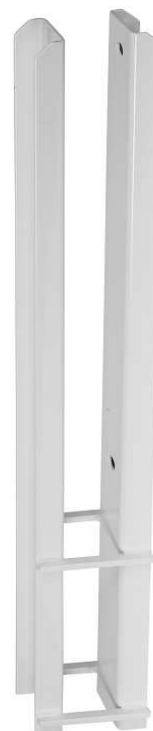
Fot for nedstøping